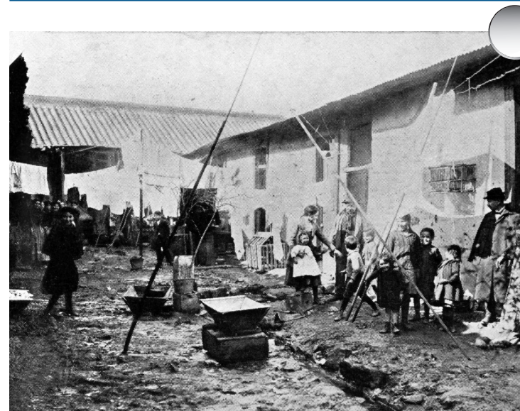
Un conventillo, hacia 1900. Fotografía publicada en: Impresiones de la República de Chile en el siglo veinte: historia, gente, comercio, industria y riqueza. Londres: Jas. Truscott and Son Ltd., 1915. 568 p.