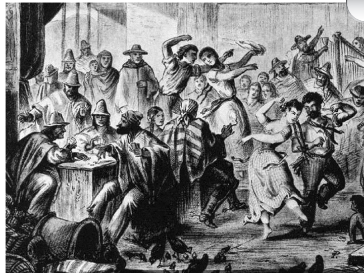
Chingana en Tres Puntas, grabado de una fecha cercana a 1852, publicado en el libro Fünfzehn Jahre in Süd-Amerika an den Ufern des Stillen Oceans, de Gesehenes y Erlebtes von Paul Treutler . Leipzig: Welt Post, 1882. Colección Biblioteca Nacional de Chile, Archivo Fotográfico y Digital.